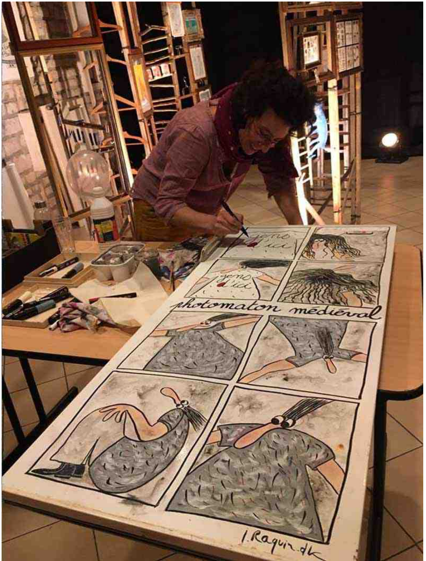
ISA-LA-CROBARDE-RAQUIN-LA-GRAPHEUSE 2019 - Festival d'Humour et de Création / Série les Givrés Acrylique sur porte de frigo